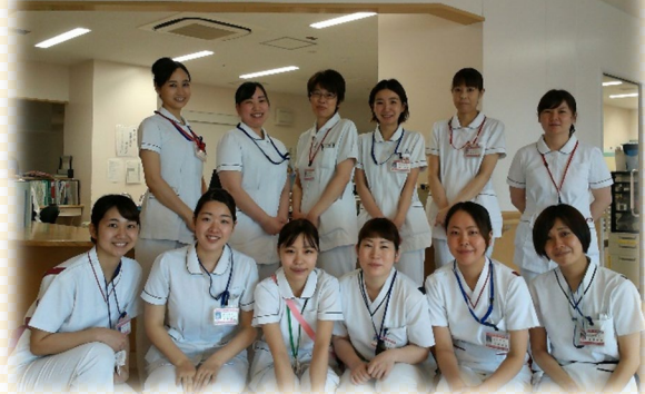
スタッフステーション Staff Station

経験豊富な看護師も多く、公私に渡り、色々な相談を親身に聞いてくれるアットホームな病棟です。