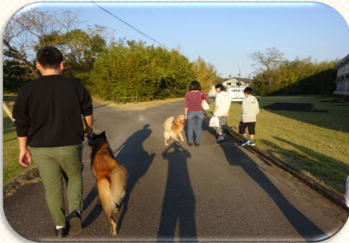
アニマルセラピー

病床数30床の1階病棟は、児童精神科病棟になります。 医師・看護師・心理士・精神保健福祉士が在籍しています。 多くの医療スタッフが連携して、家庭・福祉・教育・保健とともに、 困り感のある子ども達を「治療」し、「育てる」環境を提供します。